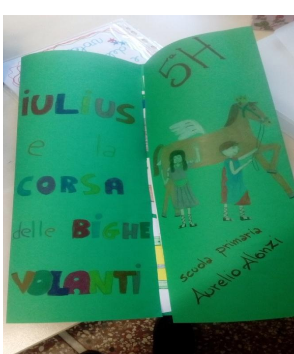
IL LAP BOOK