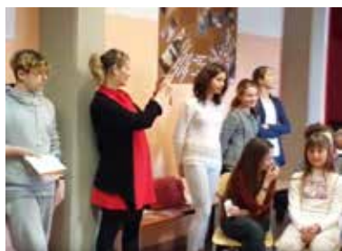
Il Benvenuto ufficiale