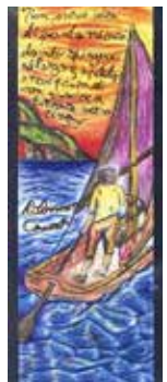
2° PREMIO EX AEQUO