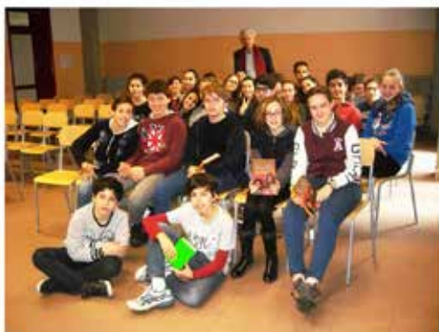
La classe 2C accoglie l'autore protagonista di questa giornata