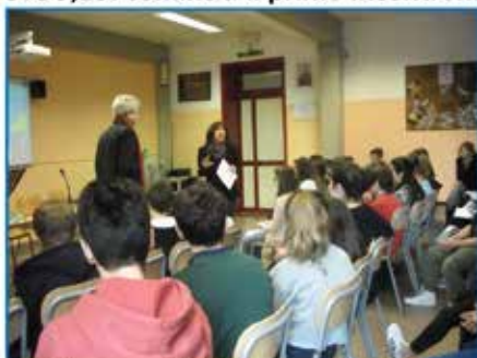
Ora ci siamo proprio tutti: sono arrivati anche i ragazzi della 2E, della 3G e una rappresentativa della II A.